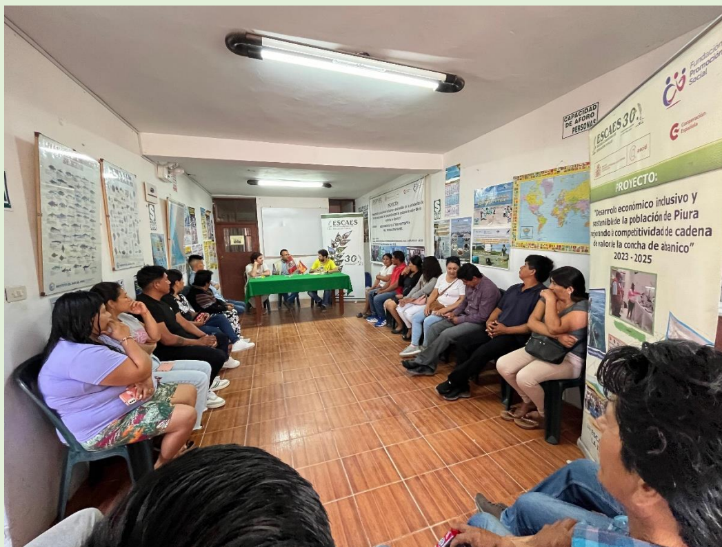
FOTO 3.- Líderes maricultores/as de 15 PYMES, y representantes de la FUNDACIÓN MAINEL en su visita al proyecto, 10 de diciembre del 2024 en ESCAES Sechura.

Durante la reunión se resaltó la intervención de los maricultores quienes agradecieron la presencia de los ilustres visitantes al proyecto, y mencionaron que la capacitación e implementación que vienen recibiendo a través de la ejecución del proyecto, está permitiendo mejorar sus actividades de cultivo de la concha de abanico y diversificar su actividad, haciéndola sostenible en la Bahía de Sechura, mostrando su optimismo de continuar superándose contando con la capacitación que vienen recibiendo por los profesionales de ESCAES igualmente mostraron su agradecimiento a la Cooperación Española por su aporte en la generación de oportunidades de participar en el proyecto, lo que les está permitiendo fortalecer sus capacidades.