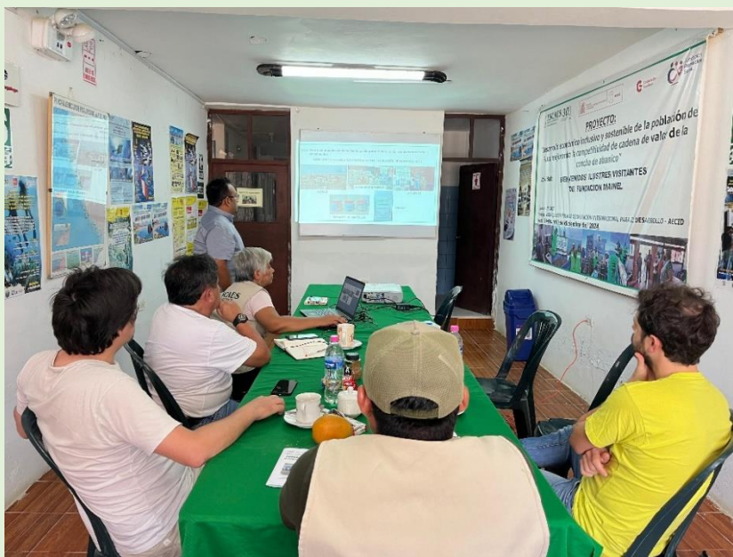
FOTO 1.- Presentación y saludo del Equipo Técnico ESCAES a representantes de la FUNDACIÓN MAINEL, 10 de diciembre del 2024 en Sechura.

En esta oportunidad el Equipo Técnico de ESCAES, acompañó a los representantes de la FUNDACIÓN MAINEL durante su visita en Sechura y Piura; así el día martes 10 de diciembre se realizó la presentación del Equipo de ESCAES Sechura y exposición de actividades del Proyecto.