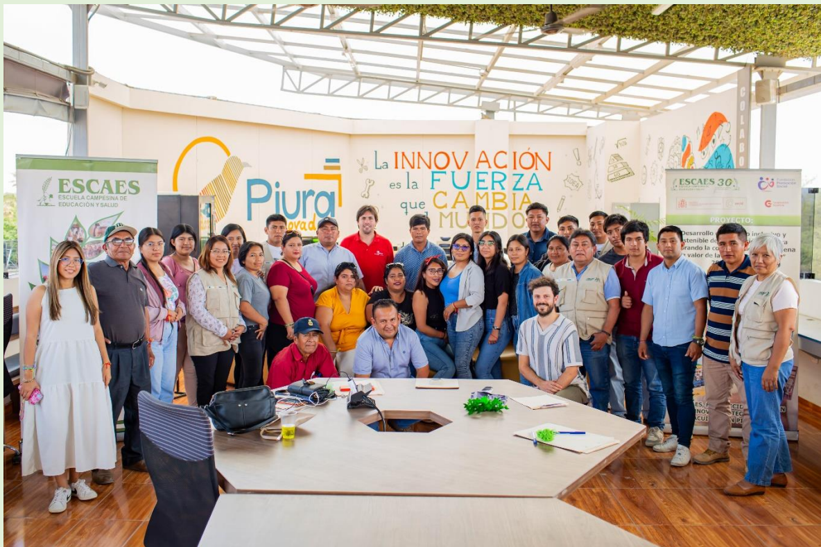
FOTO 9.- Maricultores/as de 15 AMYPES del litoral de Sechura, agricultores/as de las OPPAs de la Región Piura, equipo técnico de ESCAES y representantes de la FUNDACIÓN MAINEL, en el curso de marketing digital, 12 diciembre del 2024 en CAMCO Piura.