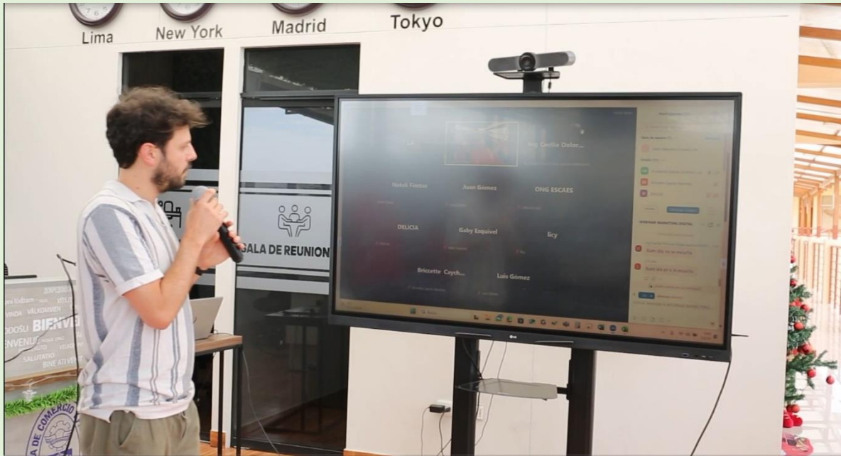
FOTO 8.- Participantes online, en el curso sobre marketing digital, 12 diciembre del 2024 en CAMCO Piura.