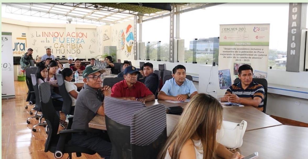
FOTO 7.- Maricultores/as de 15 AMYPES del litoral de Sechura y agricultores/as de las OPPAs de la Región Piura, en el curso de marketing digital, 12 diciembre del 2024 en CAMCO Piura.

El día miércoles 12 de diciembre se continuó con el Webinars internacional, impartiendo los temas sobre planificación editorial, análisis de los videos, con la exposición de los trabajos realizados complementando con dinámicas de grupo.