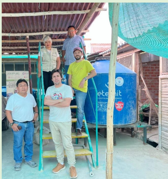
FOTO 2.- Visita de representantes de la FUNDACIÓN MAINEL a la biofábrica de producción de biofermentos, 10 de diciembre del 2024 en Sechura.