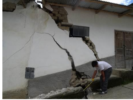
Hundimiento de la calle Carlos Fischer y su intersección con la calle Ramón Castilla en Sócota (1.2 m de desnivel y viviendas afectadas por fallas geológicas)