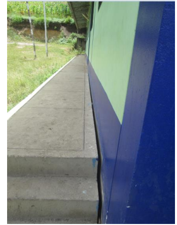
Daños en la infraestructura educativa en el caserío de Guineamayo, Sócota

Las municipalidades distritales de Sócota y San Luis de Lucma se encuentran realizando diversos esfuerzos por socorrer a las familias afectadas; sin embargo, debido a que las gestiones municipales actuales recién se inician, apenas han podido llevar alimentos a los pobladores más perjudicados, reabrir las carreteras o levantar alguna información al respecto (como un registro de familias afectadas) y elevar informes al gobierno Regional y Central. Por ende, hasta el momento no se tiene una ayuda oportuna y acorde a las actuales necesidades de la población que se encuentra damnificada.