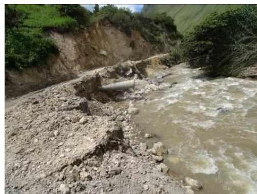
Desborde de los ríos que se ha llevado la plataforma de las carreteras en Sócota.