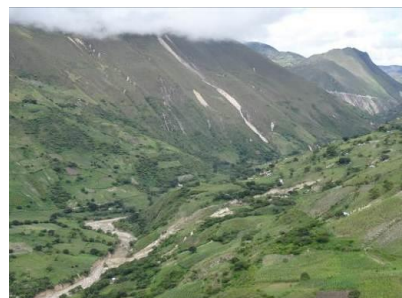
Deslizamiento de terrenos agrícolas en el caserío de Tunas Loma, San Luis de Lucma