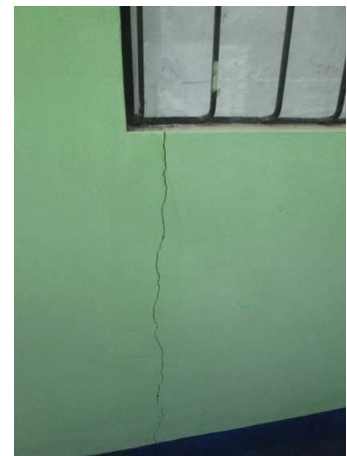
Daños en la infraestructura educativa en el caserío de Guineamayo, Sócota

Las instituciones educativas afectadas con la colmatación de ambientes, resquebrajamiento de paredes, filtrado de techos y humedecimiento de las estructuras son, en Sócota, la de Churumayo, Liguñac, Huarrago, Guineamayo, Minas, Mochadin, Mangalpa, San Lorenzo y la IE Inicial N° 515 en el Sector Pueblo Nuevo; y, en San Luis de Lucma, la de La Libertad, Sairepampa, Santo Domingo y del Tingo. Esto ha provocado que actualmente se suspenda las labores académicas por la dificultad que tienen los docentes para acceder a dichas instituciones y por el mal estado de la infraestructura de las mismas.