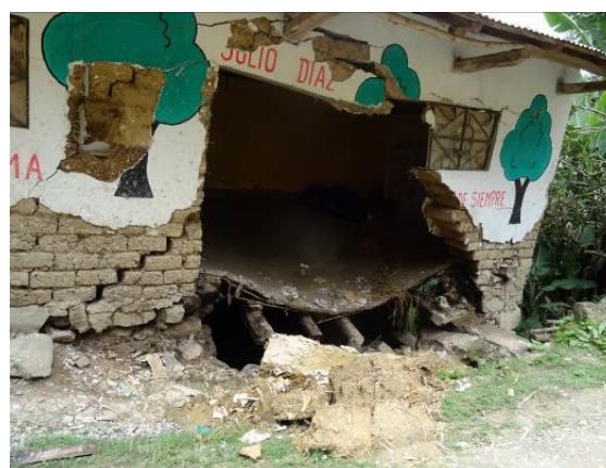
Viviendas colapsadas en el caserío de la Libertad, San Luis de Lucma