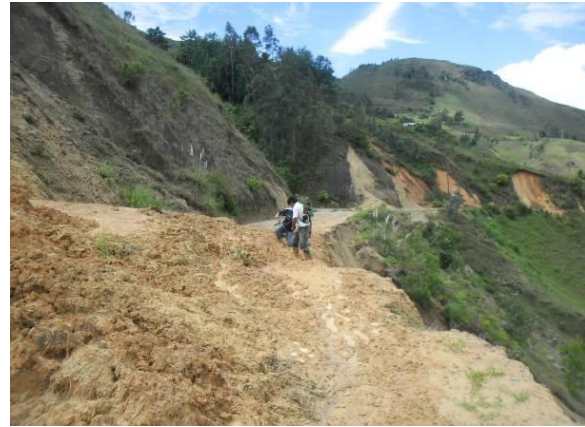
Bloqueo de las carreteras Sócota-Guineamayo y Sócota-San andres