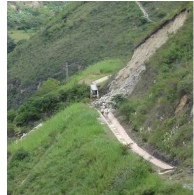
Interrupción del canal alimentador a la Central Hidroeléctrica de Guineamayo en Sócota

Las constantes lluvias han provocado que la Central Hidroeléctrica de Guineamayo, que se encuentra ubicada en el distrito de Sócota, sufra el derrumbe en varios tramos del canal alimentador. Esto ha provocado que dicha central deje de funcionar y que, por ende, se interrumpa el abastecimiento de energía eléctrica de todos los caseríos aledaños que ya estaban en prueba con el proyecto PAFE 3 y de las ciudades cercanas que se beneficiaban de este servicio.