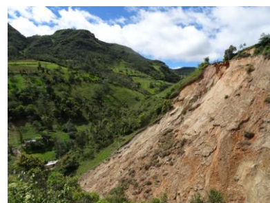
Derrumbes de terreno agrícola en el caserío de Minas, Sócota