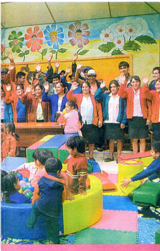
de 500 niños menores de 3 años son capacitados por

tran dinámicos en las travesuras, advierten de su curiosidad manipulando las piezas didácticas, son menos propensos al llanto y la sonrisa les brota a cada momento. Es obvio su agilidad mental, capacidad de iniciativa y control de sus impulsos en comparación a otros niños de su edad, incluso con muchos de la ciudad de Cutervo, que no cuenta con un CET, como sí lo tienen en la microcuenca Yatún.