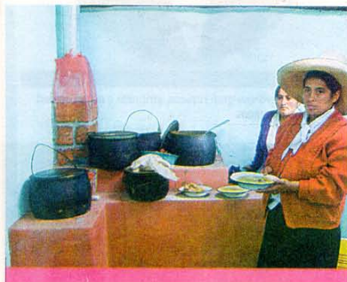
Las viviendas son más habitables con las cocinas mejoradas. Previene la irritación de los ojos y las fosas nasales.

El Proyecto Integral de la Microcuenca Yatún no contempla solamente que los niños sean estimulados para la actividad intelectual y física, sino que también incide en las condiciones del entorno en el que se desarrolla el menor. Sus viviendas son más habitables con la implementación de las cocinas mejoradas, las