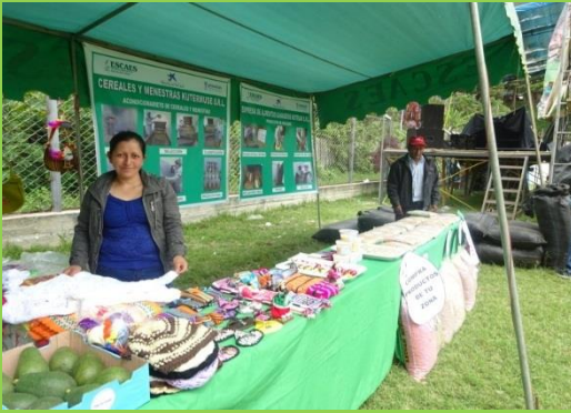
Exhibición de productos de artesanía al público asistente a la Feria

El pasado martes 31 de enero del presente año en el Distrito de Sócota se llevó a cabo la XVIII Feria Agropecuaria, en honor a la Virgen de la Candelaria, en la que se contó con la participación de las Artesanas de la Asociación USHKAS - Cutervo, asistieron aproximadamente 1.500 personas. Se presentaron una variedad de prendas artesanales de lana de ovino, tejidas a callhua elaboradas por el grupo de artesanas que ha sido promovido desde su constitución por la ONG ESCAES.