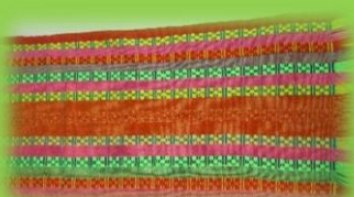
Camino tejido a