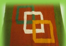
Cojín tejido a Telar