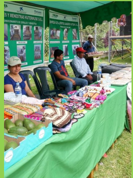
Mostrando los productos de artesanía en la Feria Agropecuaria - Sócota

Durante el transcurso de ésta importante Feria, se realizó la venta de todos los productos artesanales elaborados a mano y de manera tradicional, con lindos diseños y mucho arte poco común de encontrar.