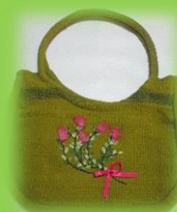
Bolso lana de Ovino